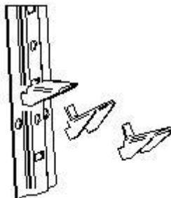
Rys. 2. Montaż zaczepu półki.

Szafy dostarczane są z półkami zapakowanymi oddzielnie i ułożonymi na dnie. Po rozpakowaniu półek należy umieścić zaczepy półek (znajdujące się w woreczku) w odpowiednie otwory w listwach(rys.2). Na zaczepy półek położyć półki. Umieszczenie półek zależy od potrzeb użytkownika i może być regulowana